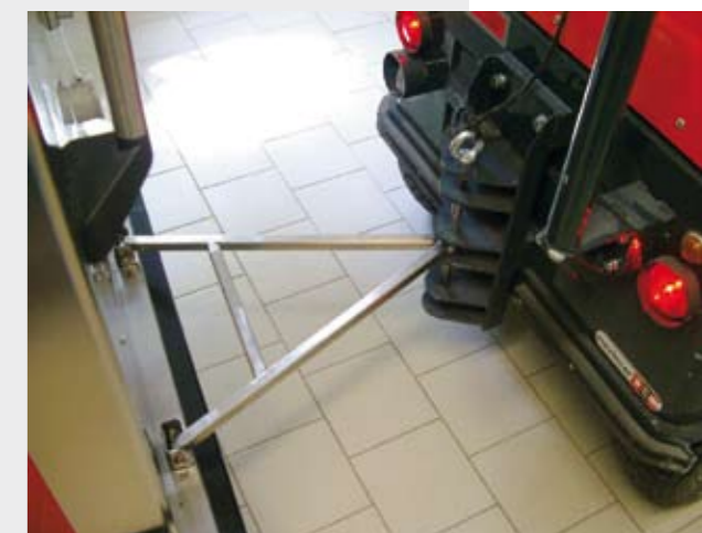
Trailer attachment for the food trolleys.

As is the case for all of Menü Mobil's system solutions, Bad Mergentheim's individual requirements were implemented during production (e.g. the cars were equipped with a trailer attachment).