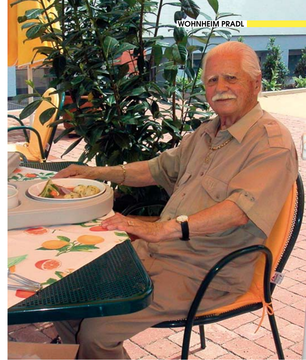
Die Menschen im Wohnheim Pradl in Innsbruck sind mit der Qualität der Speisen seit Jahren höchst zufrieden.