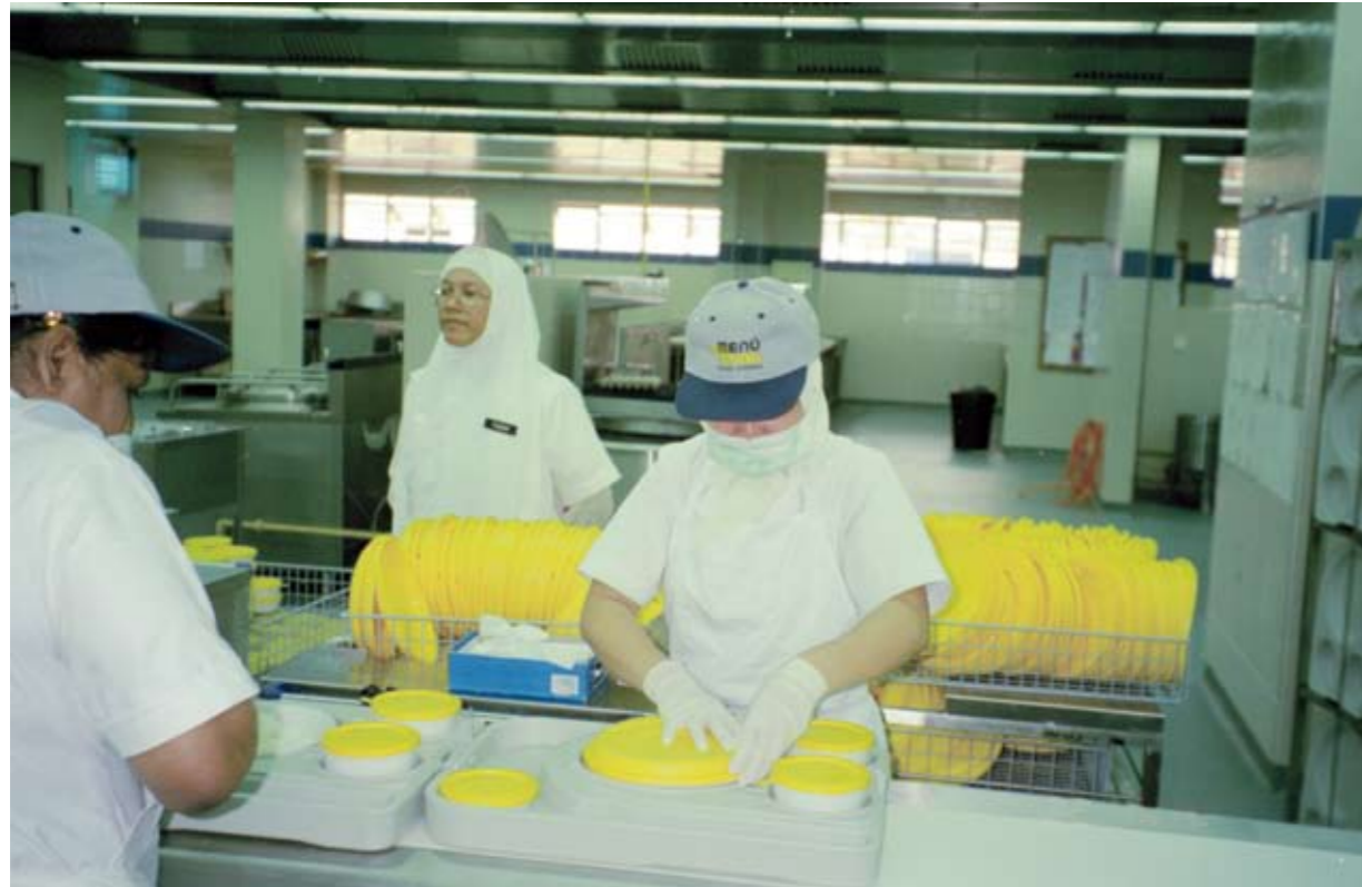
Mit dem Menü-Mobil-System „Universal“ ist man in malayischen Krankenhäusern seit Jahren sehr zufrieden.